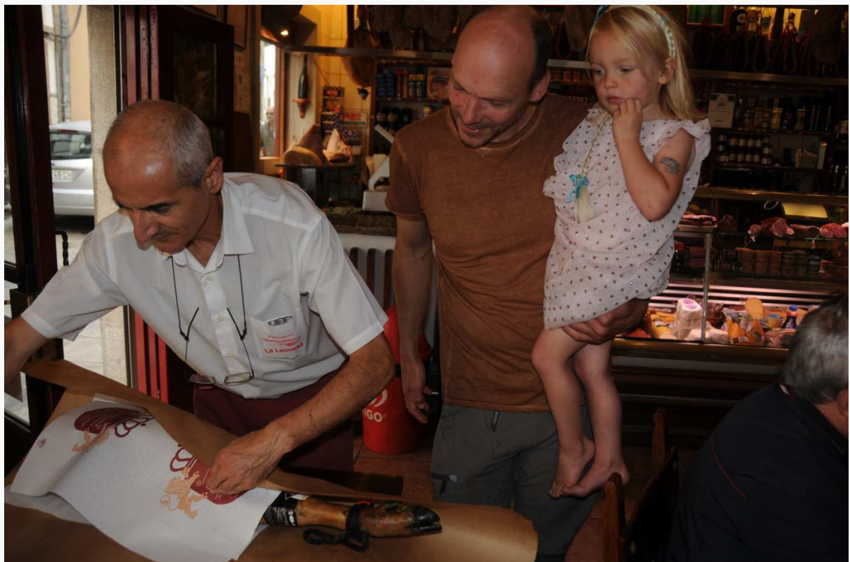
I Spania lette familien etter den perfekte skinka.

- Det ble en artig greie! Skinka har hengt i båten siden vi kjøpte den, og nå har vi nesten spist den opp, sier hun.