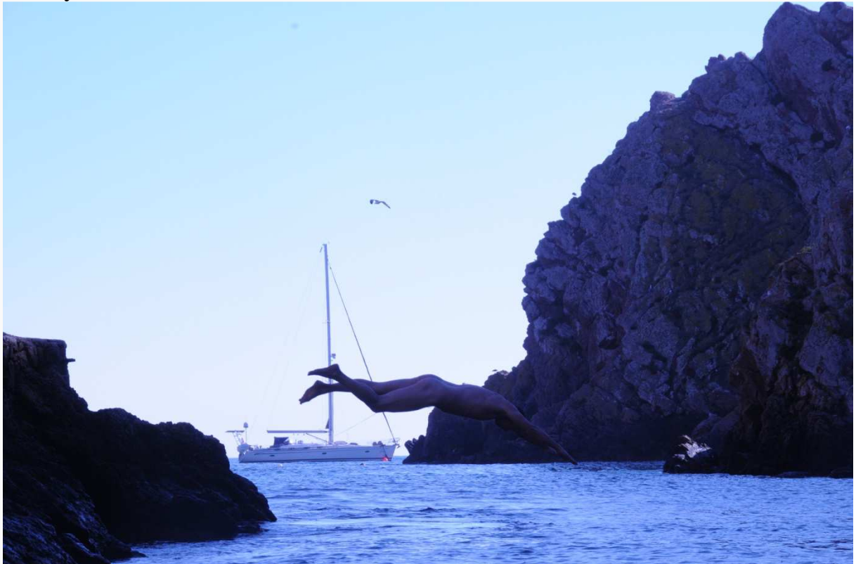
Ved Islas Berlengas ble det tid til et stup.

- En gang hadde vi en flokk på kanskje 200 delfiner rundt båten. Det rett og slett sydet av delfiner.