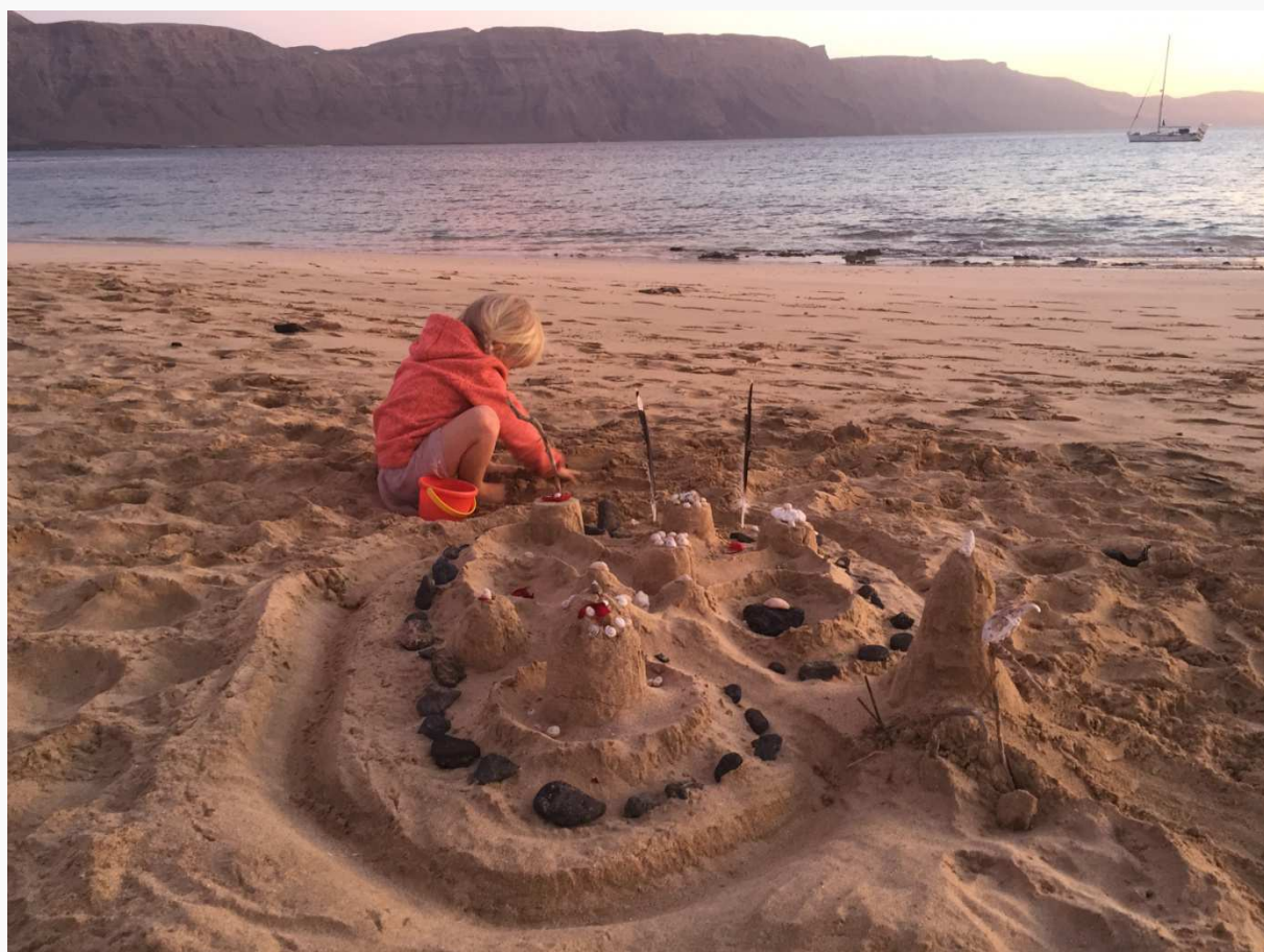
Lek på stranda med seilbåten i bakgrunnen.